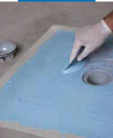
Пропитка полотна Drain Vertical при помощи Mapelastic AquaDefense