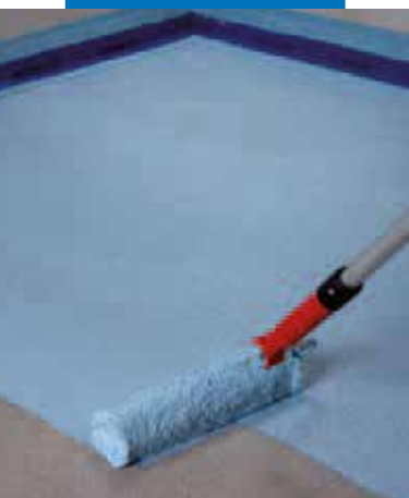
Нанесение первого слоя Mapelastic AquaDefense на стяжку

и мощных средств, которые обычно используются для очистки жилых помещений.