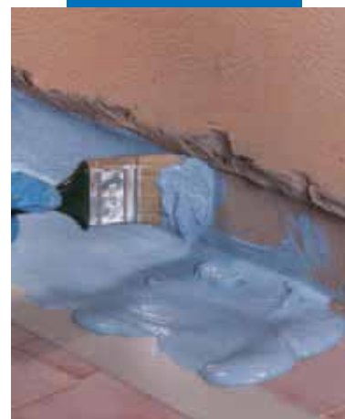
Нанесение кисточкой Mapelastic AquaDefense в углу примыкания пола и стены перед нанесением Mapeband