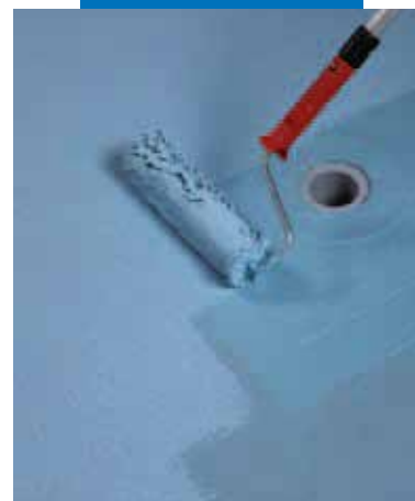
Нанесение валиком второго слоя Mapelastic AquaDefense