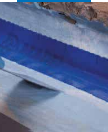
Укладка Mapeband на галтель примыкания стена-пол с помощью Mapelastic AquaDefense