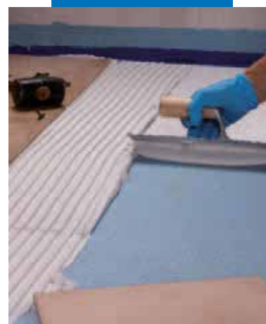
Укладка плитки поверх Mapelastic AquaDefense

Значения адгезии согласно EN 14891 измеренные с применением Mapelastic AquaDefense и цементного клея типа C2 согласно EN 12004.